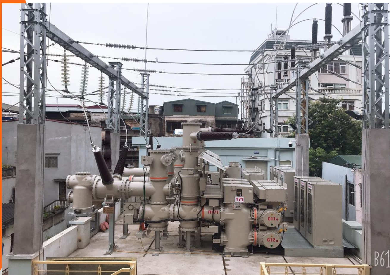
Trạm GIS 110 kV Phương Liệt