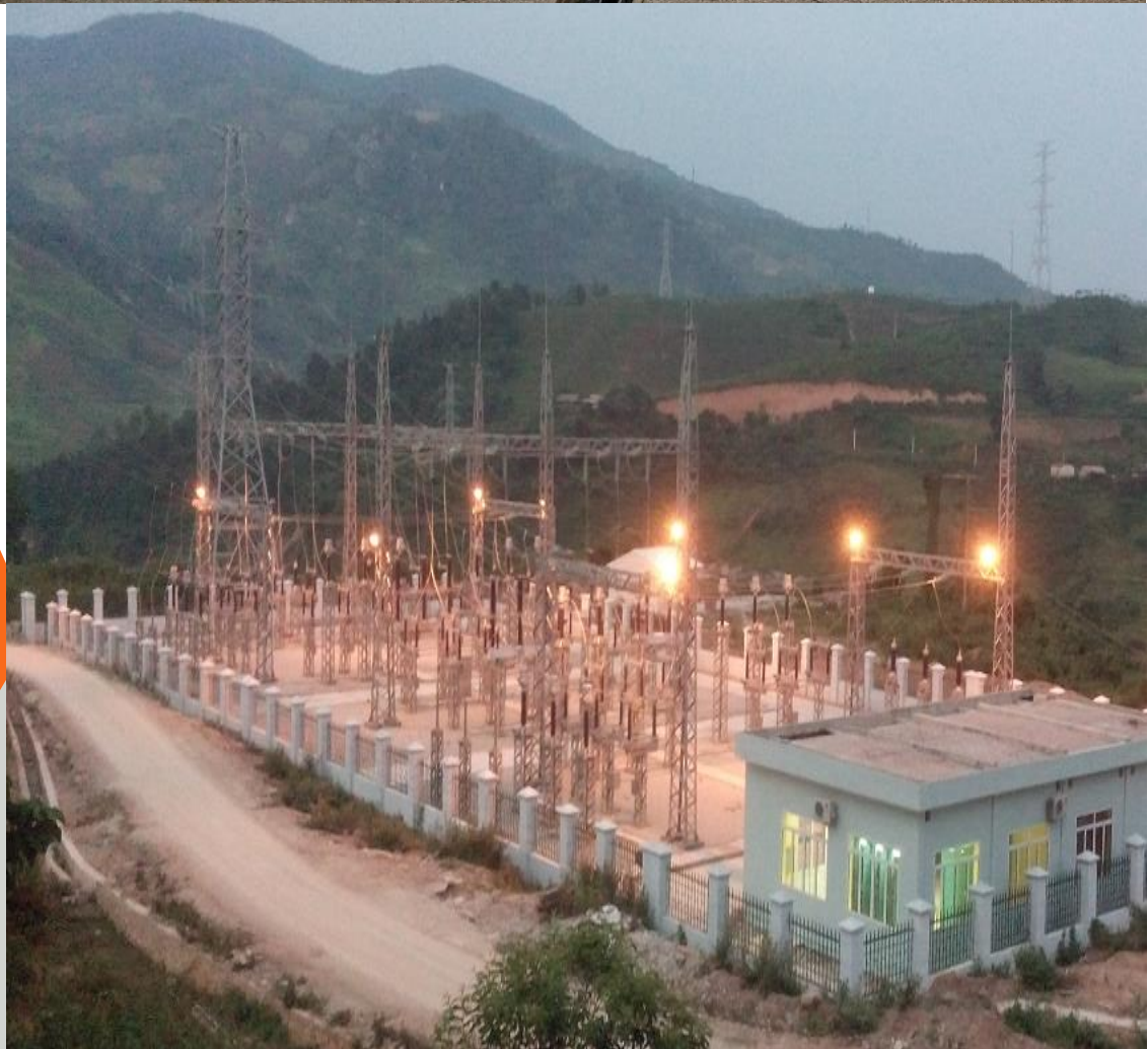
Thủy điện Nậm Mức/BITEXCO